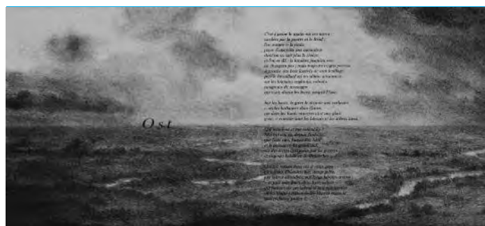
Détail de la lithographie originale de Philippe Ségal

Catalogue avec lithographie originale en série limitée : 100,00 €