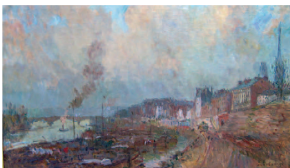
Albert Lebourg Le prés aux loups , Ca 1905 Collection particulière © Dominique Langlois