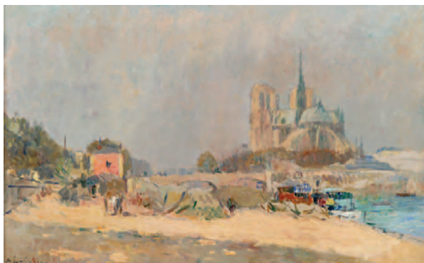
Albert Lebourg Notre-Dame de Paris , Ca 1910 Collection Musée Alfred Canel – Legs Germaine Pasqualini