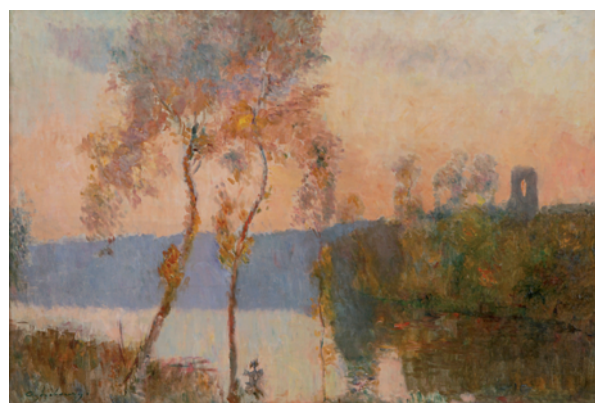
Albert Lebourg Chalou Moulineux , Ca 1910 Collection particulière