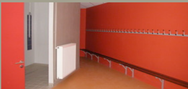
Un des vestiaires de la nouvelle salle

Autre point fort de ce nouvel équipement : l'isolation. Elle a été particulièrement soignée au regard des normes en vigueur pour les installations sportives, et cela dans le cadre d'une démarche environnementale et de maîtrise de l'énergie. Dans ce sens, des panneaux solaires permettent la production d'eau chaude au niveau des sanitaires. Concernant les extérieurs, l'aménagement d'un parking de plus de 60 places se finalise. De plus, une passerelle reliant le parking au lycée, est en cours d'installation. Les accès au nouveau gymnase se feront, par contre, exclusivement à pied ou en vélo, excepté pour les besoins de maintenance ou de livraison, afin de garantir la sécurité des utilisateurs.