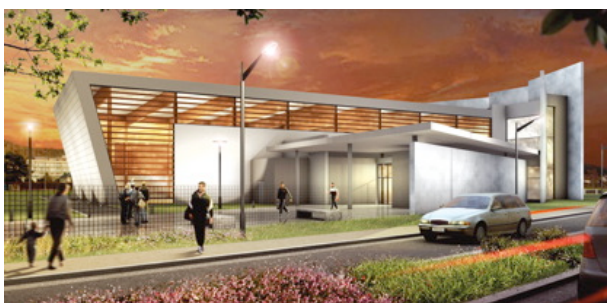
La conception de la nouvelle salle a monopolisé les deux architectes du cabinet Dédale.