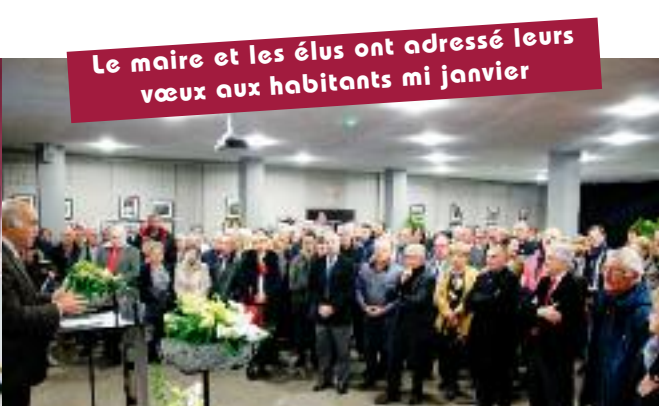
Le maire et les élus ont adressé leurs vœux aux habitants mi janvier