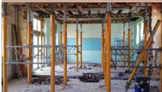
Les travaux pour la future école de musique au sein du bâtiment George Sand