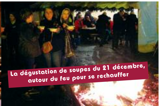
La dégustation de soupes du 21 décembre, autour du feu pour se réchauffer