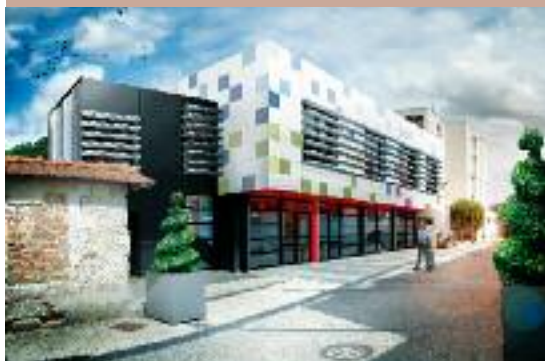
La salle des Carmes va être rénovée avec une nouvelle façade pour isolation extérieure