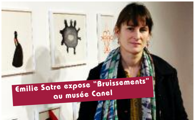
Emilie Satre expose "Bruissements" au musée Canel