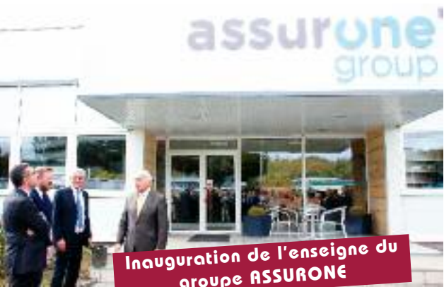
Inauguration de l'enseigne du groupe ASSURONE