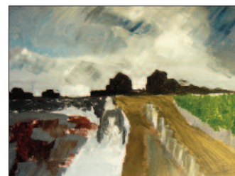
Reproduction d'une peinture réalisée par un enfant de 8 ans dans le cadre d'un atelier.

Des jeux comme la chasse aux œuvres, des ateliers de pratiques artistiques sont également organisés pour le jeune public.