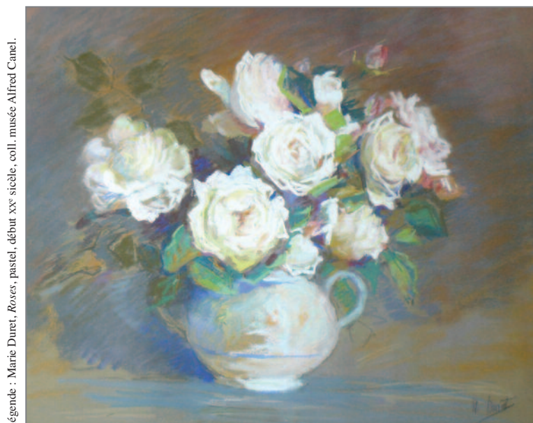
légende : Marie Duret, Roses, pastel, début XXe siècle, coll. musée Alfred Canel.

Entrée du musée et animations gratuites — Tous publics.