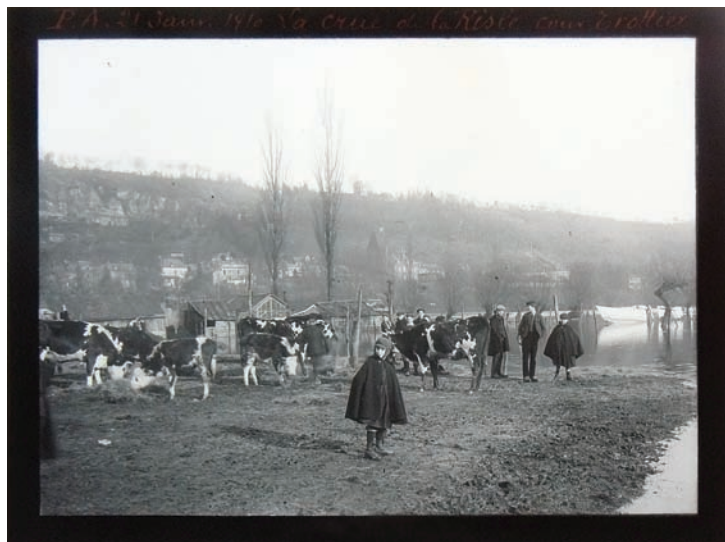
Diapositive représentant la crue de la Risle en 1910.

Dumans (1878, Mondoubleau – 1917, Rouen, Hôtel-Dieu) photographe amateur ayant exercé la profession de pharmacien à Pont-Audemer de 1900 à 1914. Jean-Jacques Biet avait déjà offert en 2010 au musée une première partie de cet exceptionnel