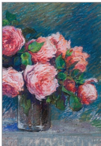
Roses - Marie Duret - collection particulière.