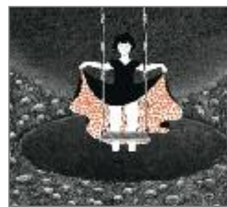
Akino Kondoh, Ladybirds Requiem , 2005/2006, film d'animation couleur, 5 min 38 s.

l'espace chez Peter Kogler ou envahit le corps chez Teresa Murak, plongeant ainsi le spectateur dans des perceptions nouvelles.