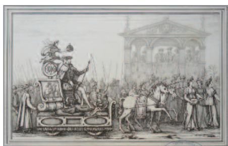
Gravure à l'eau forte de Louis de Merval extraite de Planches de l'Entrée d'Henri II à Rouen d'après les miniatures du manuscrit de la bibliothèque de Rouen, 1868.

Après le musée de l'Hôtel-Dieu de Mantes-la-Jolie et l'espace culturel Les Dominicaines de Pont-l'Évêque, le musée Alfred-Canel est de nouveau sollicité pour un prêt d'œuvres. Le musée des beaux-arts de Saint-Lô organise du 16 juin au 28 octobre 2017, une exposition consacrée au thème de la licorne, animal mystérieux qui figure sur les armoiries de la ville de Saint-Lô.