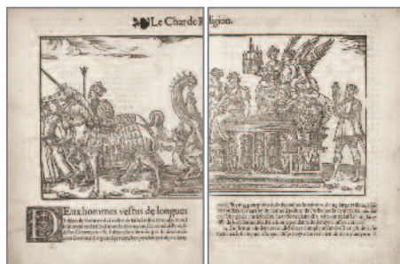
« Char de la Religion », gravure extraite de l'ouvrage de Jacques de Brévedent relative à l'entrée de Henri II à Rouen en 1550 : C'est la description du somptueux ordre plaisants spectacles (...) exhibés (...) à la sacrée Majesté du très chrétien roi de France, Henry second leur souverain seigneur [...] .