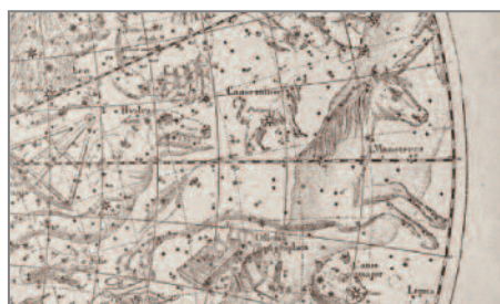
Planche imprimée extraite de l'ouvrage de Camille Flammarion, Astronomie populaire : Description générale du ciel , 1881.