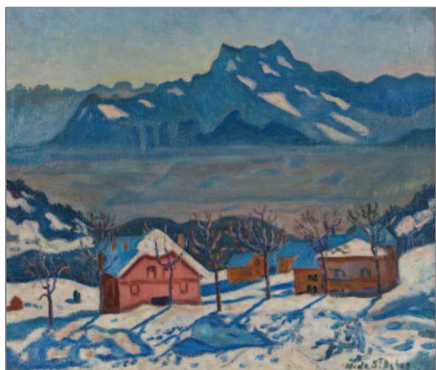
Paysage de neige, circa 1910, huile sur toile, inv. 999.0.2.

Le musée Alfred-Canel possède également un tableau d'Henri de Saint-Delis, réalisé pendant sa période suisse, que vous pouvez (re)découvrir dans le parcours des collections.