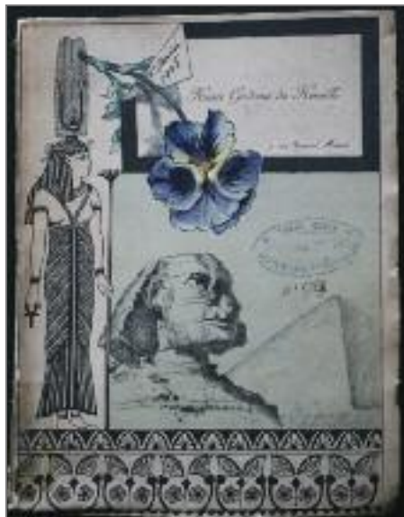
Aegypcia , œuvrette de Gadeau de Kerville, année 1905, collection du musée Alfred-Canel.

Exposition thématique, littéraire et artistique.