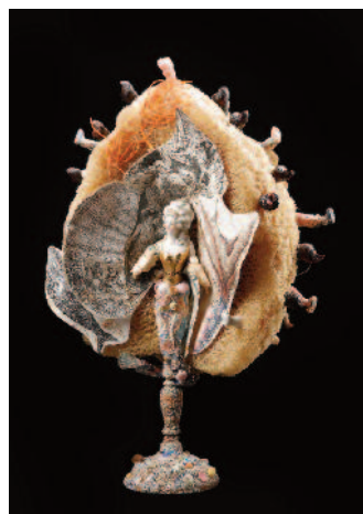
La petite sirène, 2012 ©Boris Veignant

Cette exposition d'œuvres appartenant encore à l'artiste se présente comme une plongée dans son univers singulier dont l'esprit curieux et passionné ne nous a pas semblé si éloigné de ce lieu d'imaginaire qu'est aussi le musée Alfred-Canel.